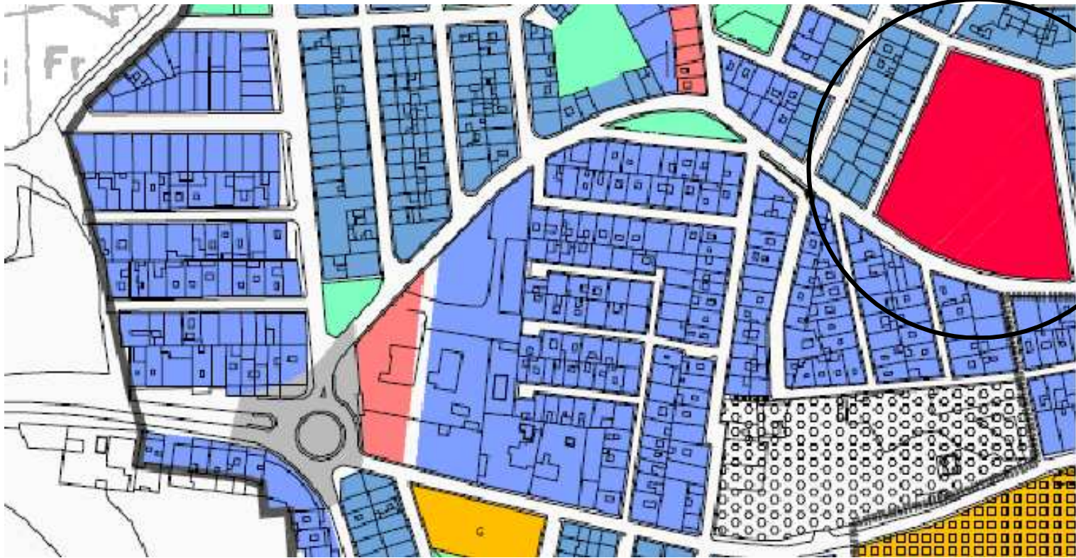
SITUACIÓN. esc. 1/1500